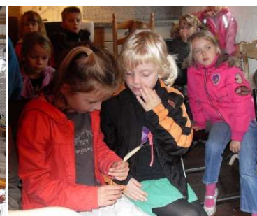
bezoek het NME-Centrum