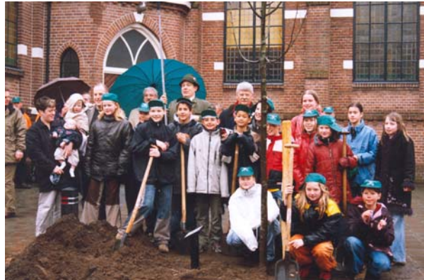
De Verbindingsboom aan de Kerklaan

Dit jaar was Ermelo accentgemeente van de provincie Gelderland. De activiteiten werden over meerdere dagen verdeeld. Het Natuur- en Milieu-Platform Ermelo had samen met de afdeling Openbare Werken van de gemeente een uitgebreid programma samengesteld. Hieraan is door de groepen 7 van tien Ermelose basisscholen meegedaan.