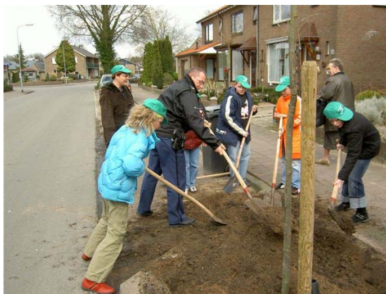
Samen met de wijkagent elzen planten langs 't Abdij

Door het winterse weer moesten de voor de week van 20 maart geplande activiteiten worden uitgesteld. Een week later kon het planten van de circa 160 bomen doorgang vinden. Het thema van de Nationale Boomfeestdag 2006 was 'Bomen en Spelen'. De negen Ermelose basisscholen die hebben deelgenomen aan de activiteiten hebben een lespakket gekregen waarmee zij op school aandacht konden besteden aan het thema. Voorafgaand aan de plantactiviteiten werd het bomenlied 'Het is tijd' gezongen en kregen de leerlingen uitleg over o.a. het planten van de bomen.