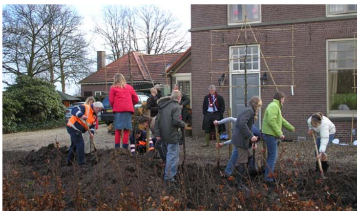
Leilinden planten in Speuld. De burgemeester kijkt toe.