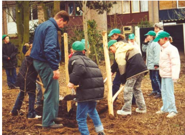
Berken en lijsterbessen planten bij de Arendshorst