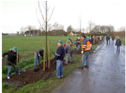
Leerlingen van de Goede Herderschool in actie langs de Groenewoudseweg