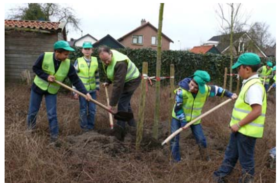
Essen planten langs De Driesten