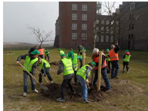
Vruchtbomen planten achter kasteel Groot Horloo