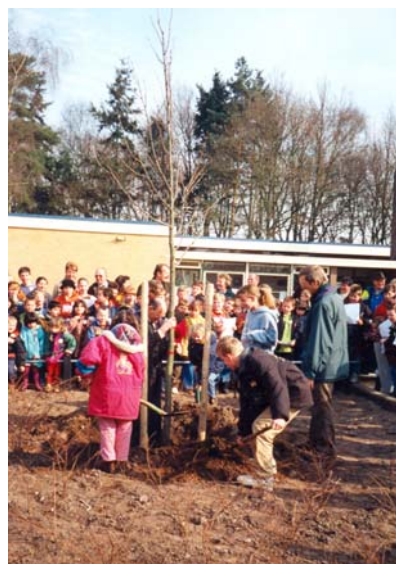
Linde planten aan de Amanietlaan voor De Cantharel

's Middags was er in de bibliotheek aan de Burgemeester Langmanstraat de video 'Lekker groeien' te zien, en werd er een verhaal voorgelezen.