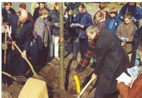
Millenniumboom planten op de hoek van de Dokter Holtropstraat en de Groeneweg

Langs de Garderenseweg in Speuld werden diverse zomereiken geplant op woensdag 22 maart 2000 door leerlingen van de Speulderbrink. Bij de Goede Herderschool in Horst een bruine beuk, bij de Koningin Julianaschool drie beverbomen, bij de Arendshorst drie sierkersen, bij de Augustinusschool twee zomereiken, bij de Ireneschool een sierkers, bij de Beatrixschool een linde en een honingboom. Tevens werd bij de scholen een bomencircuit met opdrachten voor de leerlingen uitgezet.