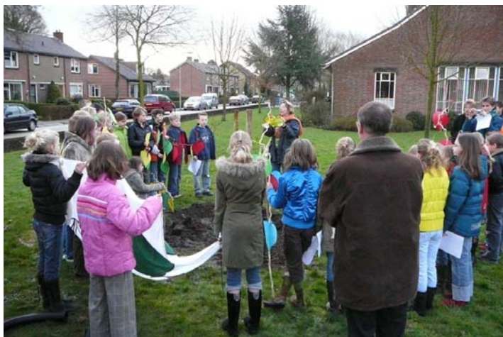
Planten van een linde in de tuin van de Beatrixschool

De Ermelose Prins Bernhardschool had zich met een eigengemaakt lied ingeschreven voor het landelijke boomfeest-songfestival. Zij kregen te horen dat zij behoorden tot de beste 10 inzendingen (van 356 scholen)! De finale met 6 deelnemers werd jammer genoeg nipt gemist maar misschien nog wel mooier was een spetterend optreden op 21 maart in de Ermelose Bibliotheek!