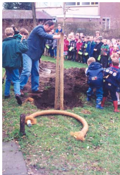
Paardenkastanje planten bij de Augustinusschool

Bij de school in Speuld werd een rode beuk geplant, ook bij de Beatrixschool plantten leerlingen een rode beuk ; bij de Koningin Julianaschool, Margrietschool en de Augustinusschool een witte paardenkastanje . Op het schoolplein van de Ireneschool een trompetboom , bij de Goede Herderschool een dakplataan , bij de Arendshorst een rode meidoorn en bij de Prins Bernhardschool een bonte vederesdoorn .