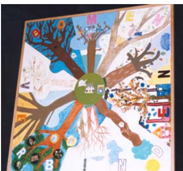
Puzzel 'Bomen Verbinden'

Vrijdag 2 april werden door kinderen van de Prins Bernardschool en Ireneschool diverse eiken , elzen en struiken geplant aan de Oude Nijkerkerweg 51.