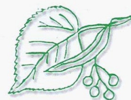
Natuur- en MilieuEducatief Centrum Ermelo