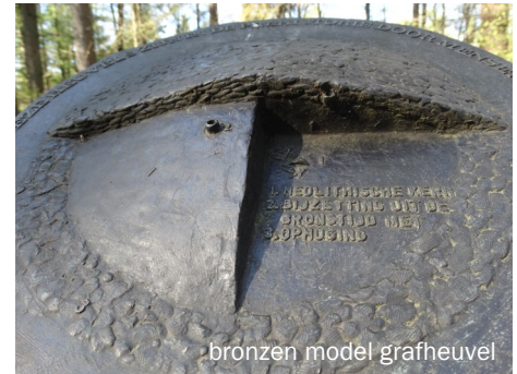
bronzen model grafheuvel