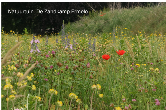
Natuurtuin De Zandkamp Ermelo