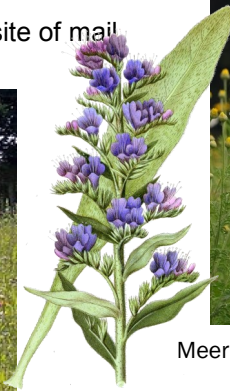
Meer foto's: www.nmpermelo.nl > Natuurtuin De Zandkamp flora en fauna van De Zandkamp (rechtsboven)